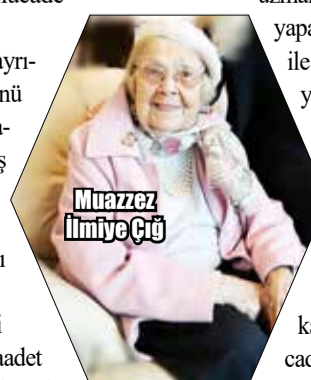
Muazzez İlmiye Çiğ

uzmanı sürekli görev yapacak ve her türlü hizmet ile ihtiyaç konusunda yönlendirici olacaklar. Ülkemizin tamamında şiddetin ve ayrımcılığın son bulduğu; daha adil, güvenli ve özgür günlere kavuşana kadar hep birlikte mücadeleye devam edeceğiz. Bu anlayışla, sesimizi daha güçlü şekilde duyurabilmek için tüm vatandaşlarımızı 25 Kasım'daki etkinliklerimize davet ediyoruz" diye konuştu.