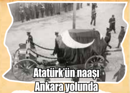
Atatürk'ün naaşı Ankara yolunda 1938 yılında, Atatürk'ün naaşı, İstanbul'dan Ankara'ya, hazin bir törenle yola çıkarıldı.