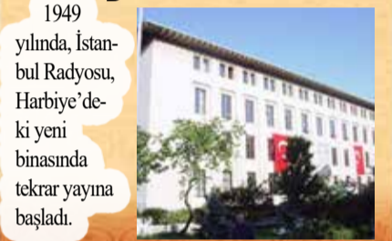
1949 yılında, İstanbul Radyosu, Harbiye'deki yeni binasında tekrar yayına başladı.