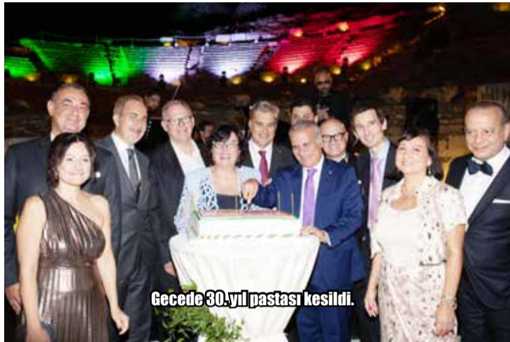
Gece 30.yıl pastası kesildi.