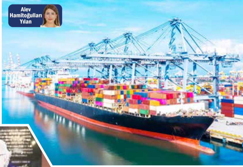
Alev Hamitoğulları Yılan

İhracatçıların kredi taahhütlerini yerine getirmek için ihracat yapmak zorunda oldukları bir süreci yaşadıklarını dilettiren Ege İhracatçı Birlikleri (EİB) Koordinatör Başkanı Jak Eskinazi,