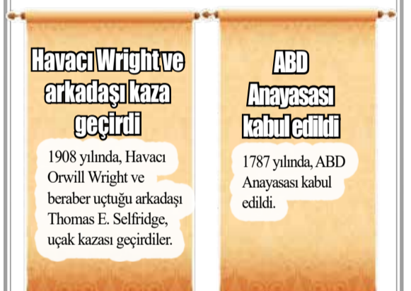
1908 yılında, Havacı Orwill Wright ve beraber uçuğu arkadaşı Thomas E. Selfridge, uçak kazası geçirdiler.