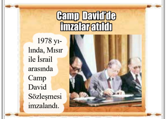
1978 yılında, Mısır ile İsrail arasında Camp David Sözleşmesi imzalandı.