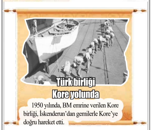
1950 yılında, BM emrine verilen Kore birliği, İskenderun'dan gemilerle Kore'ye doğru hareket etti.