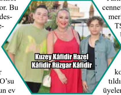
Kuzey Kâfidir Hazel Kâfidir Rüzgar Kâfidir

lerinin katılımıyla gerçekleşti. Türkiye'nin tatil cenneti Urla'nın merkezinde yer alan TSYD Bilyoner Urla Spor Tesisi, havuz başında düzenlenen açılış daveti ile konuklara tanıttı. Tesiste TSYD üyelerine özel misafirhane, havuz, cafe ve sosyal alanlar yer alıyor.